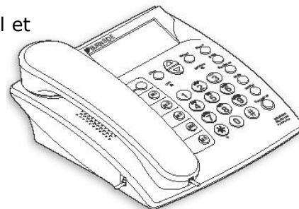
Fig. 1: Burnside P355 GSM Bordtelefon